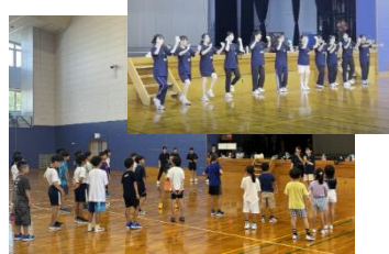
運動イベントにおける活動(隠岐)