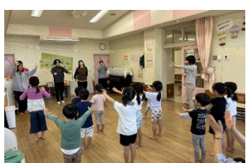
A 保育所における活動