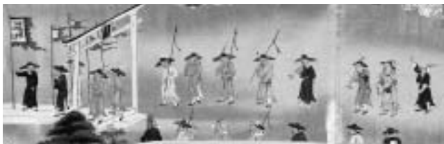
図9 - 1