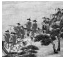
図 8 - 1