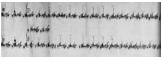
図10 - 1