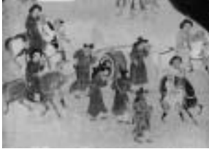
図11 - 1