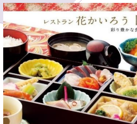
レストラン花かいろう